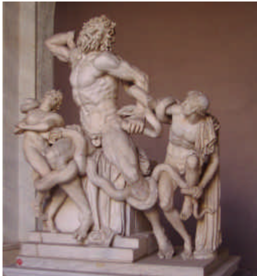
Laokoon-Gruppe in den Vatikanischen Museen, Hagesandros, Polydoros und Athanadoros aus Rhodos, vermutlich 1. Jh. n. Chr.

Im Laokoon 11 (1766) kündigt Lessing den klassizistischen Konsens auf, alle Künste würden