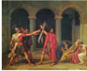
Jacques-Louis David (1748-1825) "Le Serment des Horaces" 1784 Musée du Louvre, Paris

Insbesondere im Bereich der bildenden Kunst werden die unterschiedliche Stilkonzepte sichtbar: Klassik steht für Klarheit und Ganzheitlichkeit vs. Romantik für Dekonstruktion.