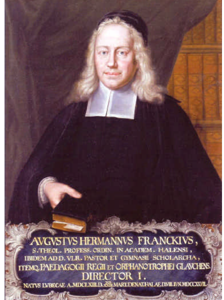
August Hermann Francke (1663–1727)