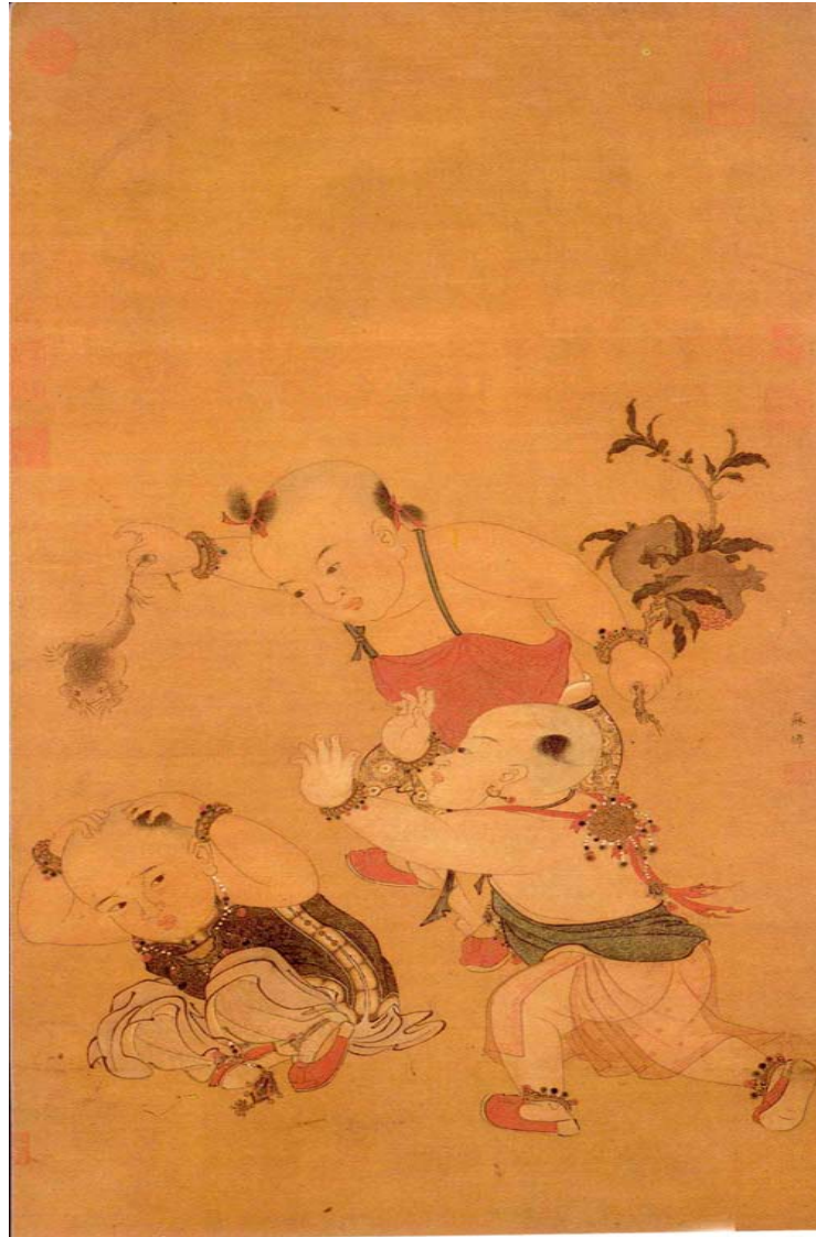
圖嬰戲陽端 焯蘇 宋 二十圖