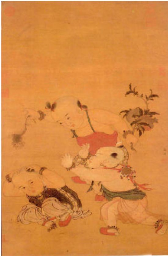
圖嬰戲圖 蘇軾 宋 二十圖

„Auch Motte und Wespe leiden unter Hunger und Kälte selbst Maulwurfgrillen und Ameisen wissen um den Schmerz Welches Tier kennt nicht die Angst vorm Sterben Und welches Wesen hat nicht den Willen zu leben? Töte nicht und schade keinem Leben.“