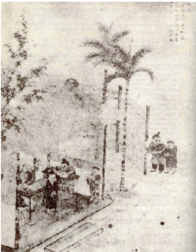
Folie 4: Gemeindeschule für einheimische Kinder She-Xue

„Ruft ein friedliches qi aus den beruhigten Herzen hervor, so wie der Frühlingswind die zarte Weide streicht oder der Nieselregen den jungen Spross befeuchtet. Wie behaglich! Wie durchdringend sind [dann] die Gefühle.“