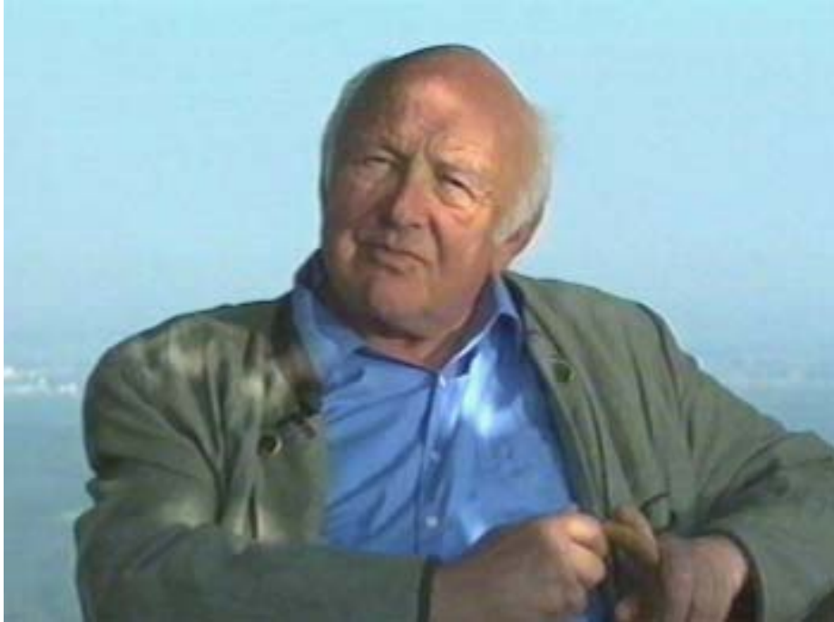
Fotografie von Otfried Preußler

von den Abenteuern des Katers berichtet, wobei er sich des Öfteren direkt an sein jugendliches Publikum wendet und Rezeptionsweisen und Verständnisschwierigkeiten antizipiert. Damit reproduziert er eine Erzählsituation, die er im Text immer wieder beschreibt.