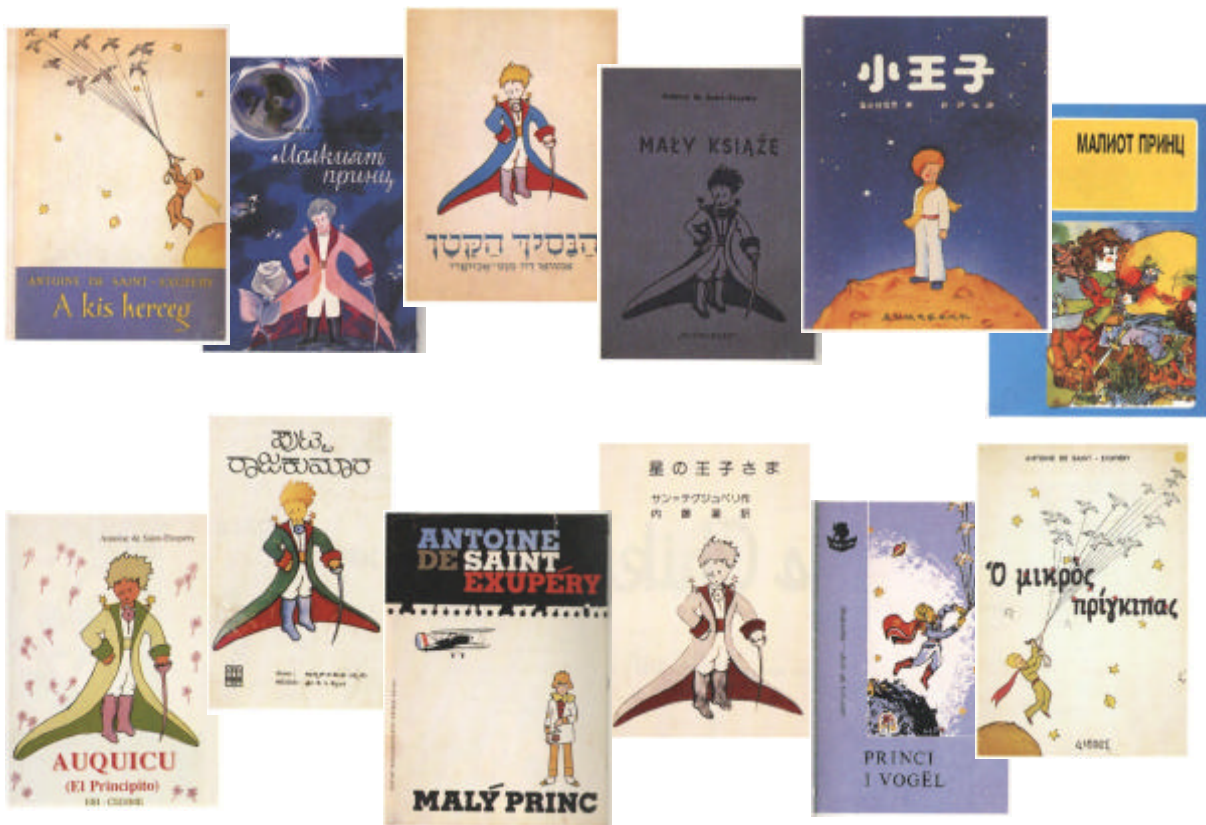
Auswahl unterschiedlicher Titelblätter

die fantastische Ausschmückung eines Tatsachenberichts , den Einbruch des Übernatürlichen und Wunderbaren , die Gleichnishaftigkeit , die Kindheitsthematik , die Bildhaftigkeit und Symbolik , wie z.B. das Bild des Fluges als Ausdruck des Überganges in andere Welten. Die Geschichte ist aus der rückblickenden Perspektive eines Piloten erzählt. Der Ich-Erzähler muss in der Wüste notlanden und sieht sich gezwungen, die Maschine binnen einer Woche zu reparieren. Länger reicht sein Trinkwasservorrat nicht. In dieser Extremsituation begegnet ihm der kleine Prinz, der dem Flieger von seiner Reise zu verschiedenen Planeten berichtet, auf denen er Menschen mit negativen Verhaltensweisen angetroffen hat, die ausschließlich mit sich selbst beschäftigt sind und sich nur an die Äußerlichkeiten der Dinge halten. Das zentrale Thema dieses ernstesten Buches bleibt aber die Aufhebung der Einsamkeit in der Freundschaft zwischen dem Prinzen und dem Piloten.