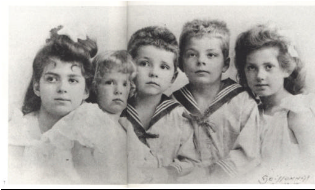
A. de Saint-Exupéry im Kreis seiner Geschwister

Antoine de Saint-Exupéry wurde am 29. Juni 1900 in Lyon geboren. Er war das dritte von fünf Kindern und lebte wie ein kleiner Prinz in den Schlössern seiner Familie, wo er eine glückliche Kindheit verbrachte, in die er sich Zeit seines Lebens wie in eine verlorene Heimat zurücksehnte. Saint-Exupéry wollte wie der Erzähler in Le Petit Prince (dt. Der kleine Prinz; 1943) eigentlich Maler werden, aber er wurde Pilot . Viele seiner Zeichnungen sind daher aus der Vogelperspektive gemalt.